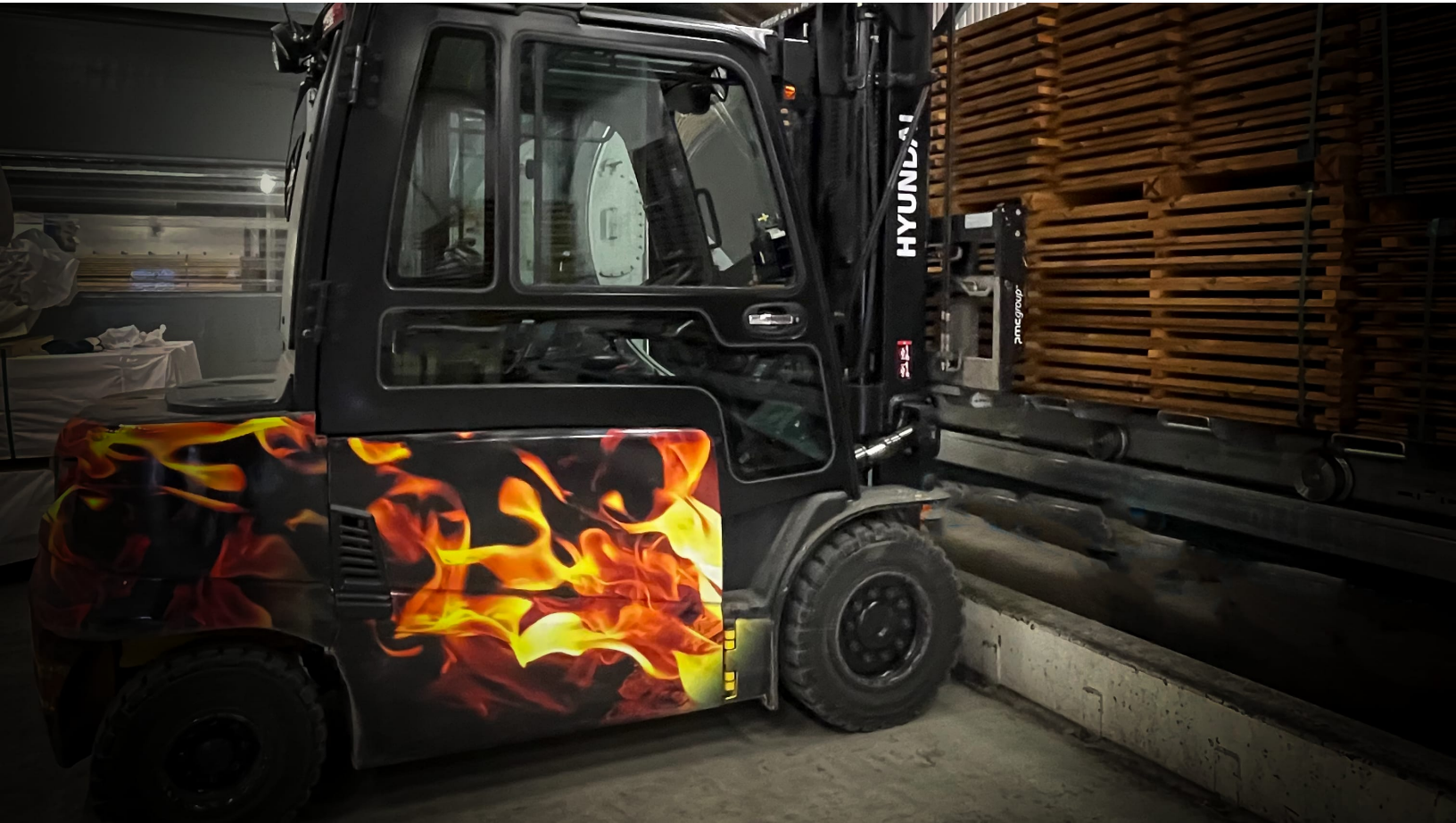
The hottest truck in the wood industry.